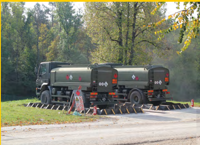
Oskrbovalna točka z gorivom