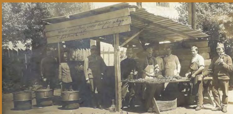
Kuharji v Slovenski Bistrici leta 1914

Zgodovina vojašnice v Slovenski Bistrici sega v obdobje 17. stoletja (1649). Trenutna vojašnica je bila zgrajena ob koncu 19. stoletja in takrat se je imenovala Franc Jozef Cavallerie Kaserne .