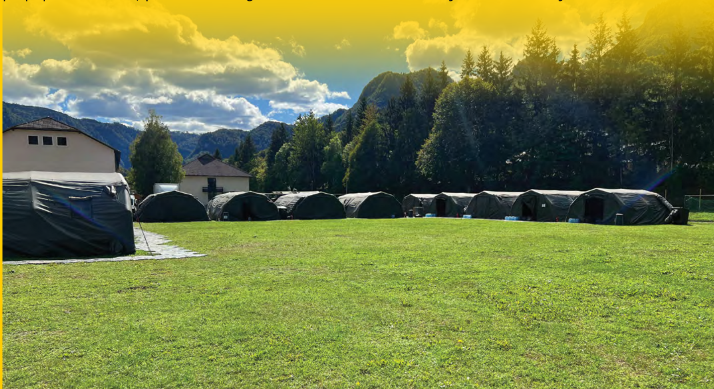
Zagotavljanje nastanitve v terenskih bivalnih razmerah (baza na Bohinjski Beli za vajo Triglav Star)

Zadnji dan vaje, 20. 10. 2022, je potekala zaključna slovesnost oziroma postroj vseh pripadnikov SV, ki so bili udeleženi na vaji. Priprave na zaključno slovesnost so potekale že en teden pred izvedbo in ključno vlogo pri pripravi sredstev, postavitvi in zagotovitvi materialnih sredstev je imel tudi tukaj 670. LOGP.