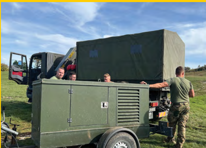
Postavitev agregata za zagotovitev električne energije v vojaški bazi Vesna