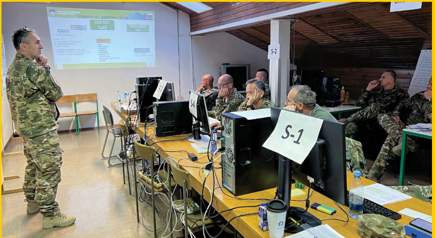
Taktični operativni center 670. LOGP, od koder so potekali poveljevanje in kontrola za vajo PRESKOK 2022 ter usklajevanje logistične podpore države gostiteljice ob prehodu sil ZDA čez Republiko Slovenijo