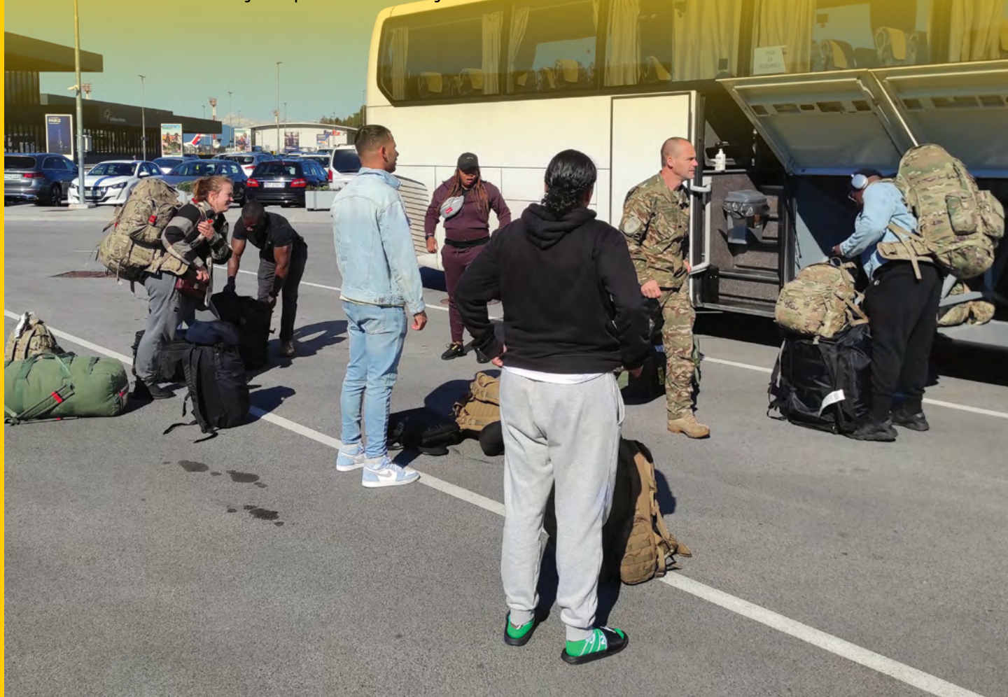
Prihod tujih oboroženih sil ZDA na letališče in prevoz z vojaškim avtobusom v VbAČ v Postojno

Ključna naloga 670. LOGP je bila vzpostavitev logističnega operativnega centra (LOGTOC) v Vojašnici barona Andreja Čehovina (VbAČ), od koder so potem potekali usklajevanje, vodenje in poveljevanje za podporo vseh vaj, ki so potekale doma in v tujini, ter realna logistična podpora države gostiteljice pri prehodu oboroženih sil ZDA čez ozemlje Republike Slovenije.