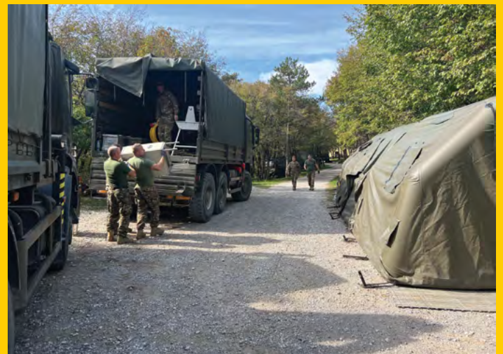
Postavitev elektrifikacije za poveljniško mesto 1. BR