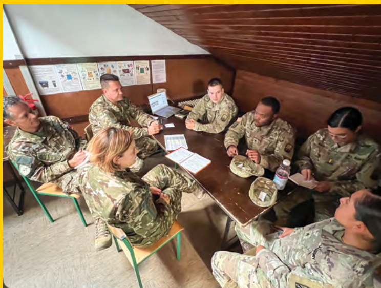
Dnevno usklajevanje pripadnikov 670. LOGP na taktični ravni s tujimi oboroženimi silami ZDA

Zadnji dan vaje, 20. 10. 2022, je potekala zaključna slovesnost oziroma postroj vseh pripadnikov SV, ki so bili udeleženi na vaji. Priprave na zaključno slovesnost so potekale že en teden pred izvedbo in ključno vlogo pri pripravi sredstev, postavitvi in zagotovitvi materialnih sredstev je imel tudi tukaj 670. LOGP.