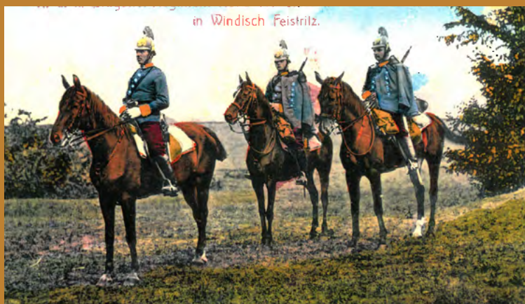
Pripadniki 5. dragonskega polka