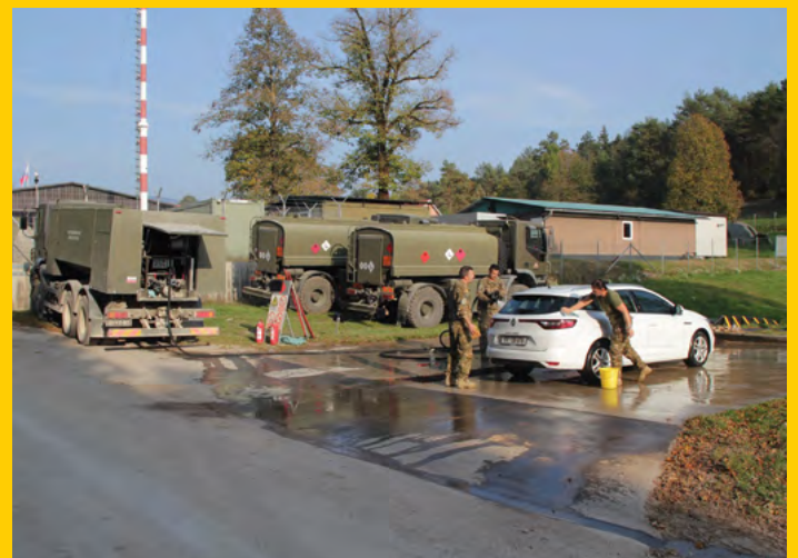
Pranje vozil z vodo iz avtomobilske cisterne