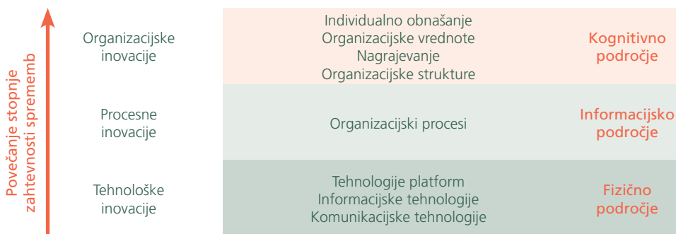
Slika 2: Stopnje zahtevnosti uresničevanja sprememb

Na področju tehnoloških inovacij je razvoj standardov interoperabilnosti dosegel novo raven, saj večina proizvajalcev uporablja standardizirane protokole, ki se združujejo v okviru koncepta storitveno usmerjenih arhitektur (Services Oriented Architecture – SOA). SOA niso samo novi standardi in protokoli, temveč predvsem koncept transformacije področja informacijskih in komunikacijskih tehnologij z bistvenimi spremembami v vodenju, kot so načrtovanje in merjenje učinkov investicij in še večji poudarek na organizacijskih procesih in inovacijah.