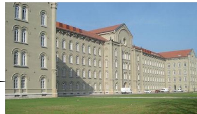
Kadetnica, Engelsova 15, Maribor