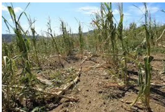
Slika 12: Posledice suše

Vpliv podnebnih sprememb se odraža v: povečanju količine padavin v zimskem obdobju, višjih zimskih pretokih, zmanjšanju količine vode, vezane v snežni odeji, in spremembi rečnih režimov, nižjih poletnih pretokih, dvigu temperature vode in tal, pogostejših kritičnih gladinah morja, povečanju poplavne ogroženosti, povečanem delovanju erozijskih sil, zmanjšanju količine podtalnice v poletnih mesecih, zlasti v območjih manj prepustnih tal (težave s preskrbo z vodo), manjši produkciji električne energije iz hidroelektrarn poleti in pozimi, manjši sposobnosti prevzemanja termičnih obremenitev, večji koncentraciji onesnaževal in manjši koncentraciji kisika v vodi (bolj pogosti pogini rib). Upadanje količine padavin poleti ima za posledico več suš z negativnimi učinki na dostopnost vodnih virov. Pričakujemo lahko daljša sušna obdobja ter krajša in krajevno razporejena obdobja intenzivnih padavin. Posledično se bodo spremenili časovni in geografski poplavni vzorci, upadli bodo srednji mali pretoki vodotokov, prav tako pa lahko pričakujemo tudi težave s preskrbo z vodo zaradi padca nivoja podtalnice oziroma črpanja zalog podtalne vode pod obstoječi spodnji nivo.