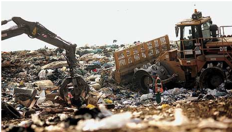
Slika 11: Odlagališče odpadkov - deponija

zaželen način ravnanja, saj zanj pomeni obremenitev in izgubo naravnih virov. Zato je dolgoročni cilj EU, postati družba recikliranja in odpadke koristiti kot vir. V zadnjih letih je bilo največ predelanih odpadkov iz industrije, okoli 80% komunalnih odpadkov pa smo odložili. Predelava komunalnih odpadkov bo predvidoma narasla z vzpostavitvijo regijskih centrov, dodatnimi spodbudami občin pri ločenem zbiranju odpadkov, različnimi finančnimi instrumenti in ozaveščenostjo prebivalcev glede kupovanja izdelkov, ki omogočajo enostavnejšo predelavo (povzeto po Rejec Brancelj I. in Zupanc N. [online], 2007).