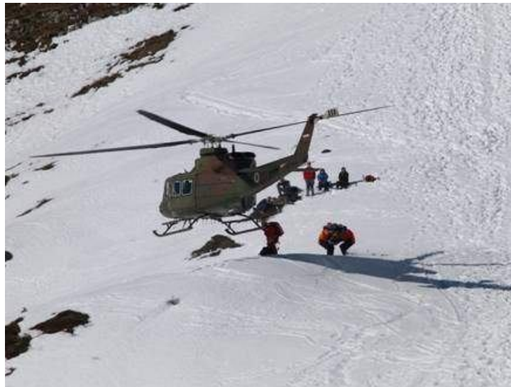
Slika 17: Reševanje ponesrečenih v gorah