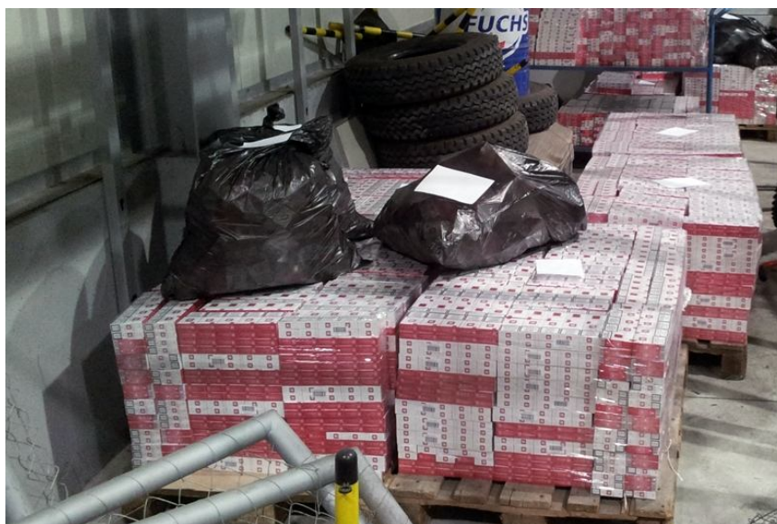
Slika 14: Zaseg tihotapljenega blaga

prepovedane droge, orožje in eksploziv. Obravnavanih je bilo 318 (l. 2010 352) ali 9,7% manj kaznivih dejanj, ki so bila posledica organizirane kriminalne dejavnosti, kot v letu 2010. Zaradi kaznivih dejanj, ki so bila posledica organizirane kriminalne dejavnosti, je bilo ovadenih 129 (v letu 2010 257) ali 49,5% manj oseb kot leta 2010. Policija je preiskave osredotočila na delovanje mednarodnih kriminalnih združb, ki so delovale v regiji, nekatere tudi v širšem okolju. Njihovo članstvo morda ni bilo tako številčno, vendar to ni zmanjšalo nevarnosti njihovega delovanja in izvajanja kaznivih dejanj. Med organiziranimi oblikami se je najbolj, s 184 na 231 ali za 25,5% glede na l. 2010, povečalo število kaznivih dejanj neupravičene proizvodnje in prometa s prepovedanimi drogami, nedovoljenimi snovmi v športu in predhodnimi sestavinami za izdelavo prepovedanih drog. To je posledica večjega števila skupnih kriminalističnih operacij s tujimi varnostnimi organi. Povečalo se je tudi število organiziranih oblik ropov s 16 na 21. Kot posledico organizirane kriminalne dejavnosti je policija obravnavala po eno kaznivo dejanje umora, lahke telesne poškodbe in zlorabe prostitucije (povzeto po Ministrstvo za notranje zadeve [online], 2011).