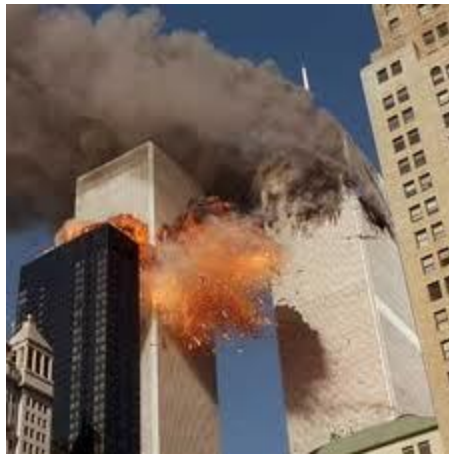
Slika 5: Teroristični napad na ZDA 11. 9. 2001

5. 11. september: V napadu na dvojčka je 11. septembra leta 2001 umrlo 2993 ljudi, ranjenih je bilo 8900 ljudi. Posledice tega napada svet čuti še danes.