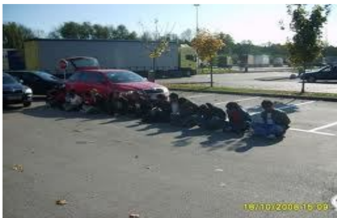
Slika 7: Ilegalci v Sloveniji

Republike Slovenije se nezakonite migracije dotikajo predvsem zaradi poteka migracijskih tokov čez njeno ozemlje. Z vstopom RS v Schengenski sporazum 8 ter z njenim prevzemom varovanja zunanje meje Evropske unije se spreminjajo tudi poti nezakonitih migrantov in njihova struktura. Po ukinitvi nadzora na notranjih mejah EU je vse pogostejši pojav državljanov tretjih držav, ki nedovoljeno prestopajo notranjo mejo z namenom tranzita, v manjši meri, zlasti pri ilegalnih migrantih z območja Jugovzhodne Evrope, pa je RS tudi ciljna država. Dodatno težo pridobiva ta varnostna grožnja zaradi svoje povezanosti z delovanjem organiziranega kriminala in terorizma.