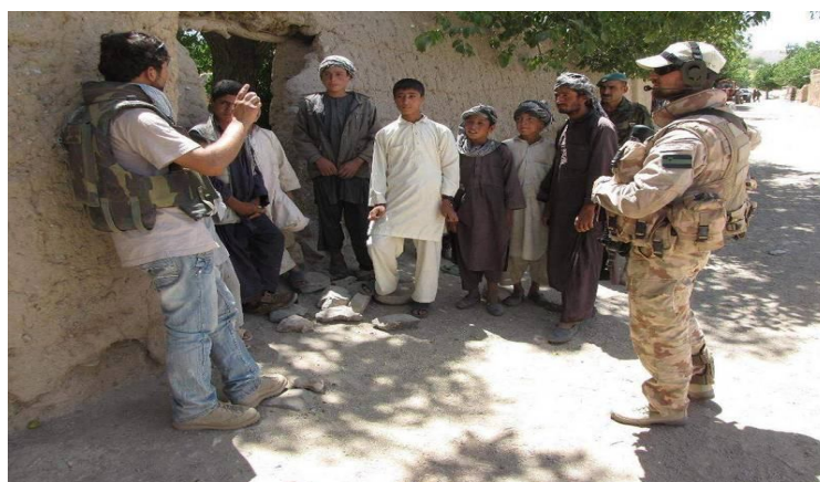
Slika 19: Pripadniki Slovenske vojske na mednarodni misiji v Afganistanu

Republika Slovenija skladno s svojimi nacionalnimi interesi sodeluje v mednarodnih operacijah in misijah na posameznih kriznih žariščih, s čimer dejavno prispeva k mednarodnemu miru, varnosti in stabilnosti. Njena prisotnost na teh območjih lahko pomeni tveganje v smislu izpostavljenosti ozemlja naše države terorizmu in drugim oblikam nevojaških groženj. Povečuje se tudi možnost, da postanejo mednarodne sile na kriznem žarišču, v katerih sodelujejo predstavniki RS, tarča napada pripadnikov sprtih strani in organiziranega kriminala.