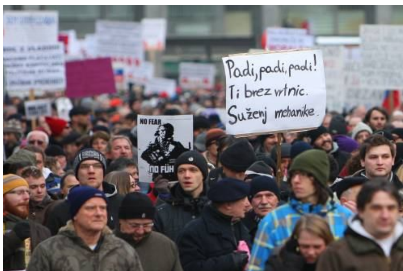
Slika 18: Demonstracije