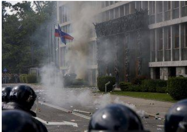
Slika 9: Vandalizem med demonstracijami