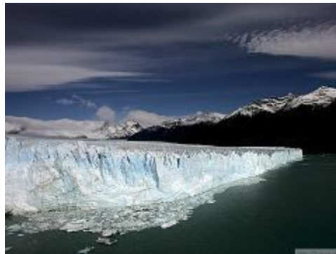
Slika 3: Taljenje ledenikov