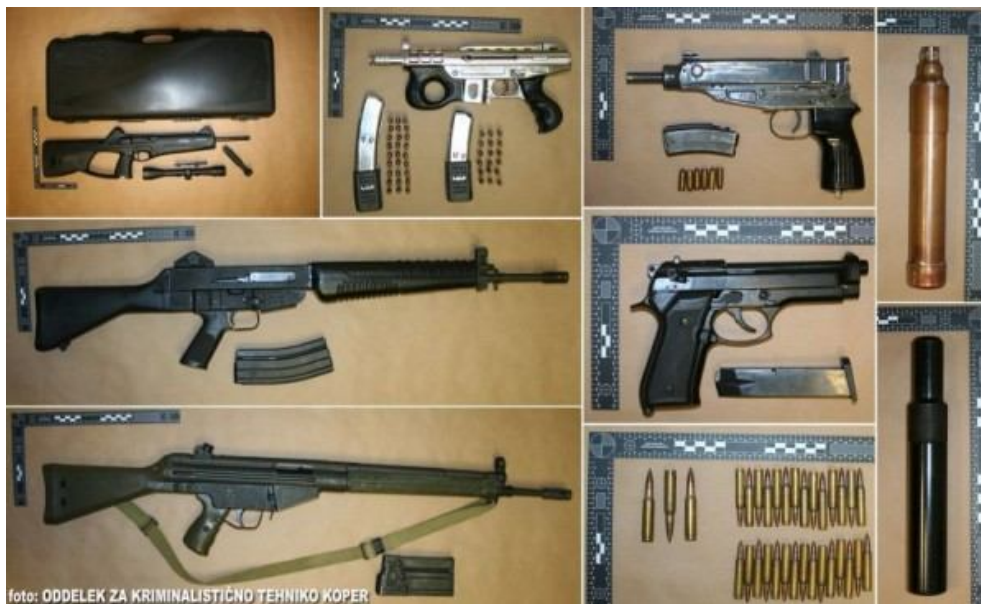
Slika 13: Zaseg orožja

da količina težkega strelnega orožja, ki je v obtoku v EU, za zdaj zadošča povpraševanju po tem orožju, pa so dobavitelji v jugozahodni Evropi sposobni zadostiti vsakršnemu povečanju povpraševanja. Dejstvo, da je mogoče kalašnikovko ali metalec raket v nekaterih delih EU kupiti že za 300 do 700 EUR, kaže, kako zlahka sta dostopna storilcem kaznivih dejanj. Policija je v letu 2011 obravnavala 108 (l. 2010 124) ali 12,9 % manj kaznivih dejanj, povezanih z orožjem, kot l. 2010, med njimi največ, 102 (122) kaznivi dejanji nedovoljene proizvodnje in prometa z orožjem ali eksplozivnimi snovmi. Zmanjšanje števila slednjih za 16,4% je posledica spleta večine dejavnikov: preteklih legalizacij, spremembe delovanja kriminalnih združb in tihotapske poti. Količina zaseženega nedovoljenega orožja, z manjšim odstopanjem, ostaja znotraj večletnega povprečja, med zaseženim orožjem je bila tudi manjša količina v kaznivih dejanjih uporabljenega vojaškega orožja (povzeto po Ministrstvo za notranje zadeve [online], 2012).