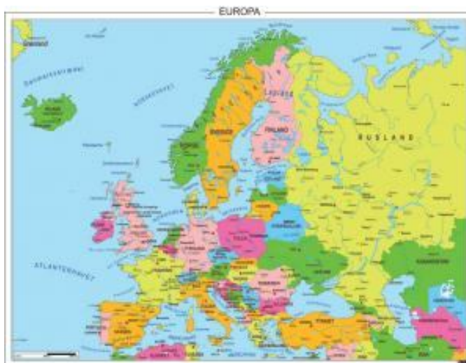
Slika 1: Politična razdelitev Evrope