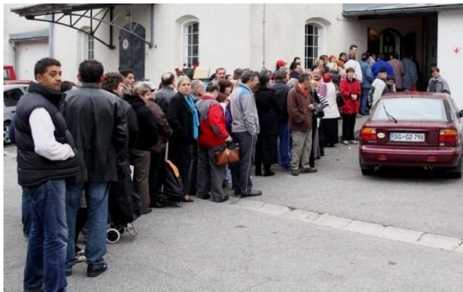
Slika 8: Vrsta med razdeljevanjem paketov Rdečega križa

temeljnih človekovih pravic in svoboščin, nenadzorovano nasilje in s tem ogrožanje človekovega dostojanstva, varnosti in življenja.