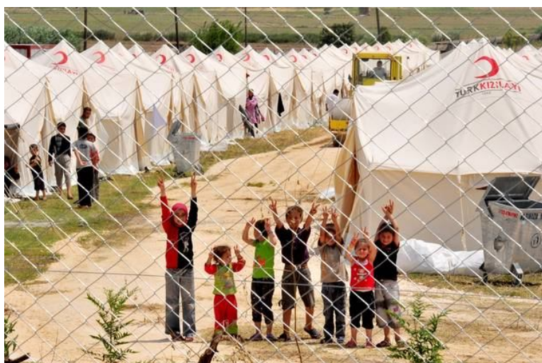
Slika 4: Begunski center

Krizna območja so v kratkem času doživela nagle fiziognomske, strukturne in funkcijske spremembe z izrazito splošno tendenco poslabšanja. Ni jih težko prepoznati, saj imajo krizna območja vrsto lastnosti, po katerih se ločijo od ostalih ozemelj. Nanje navadno opozarjajo posledice spopadov (ruševine v naseljih, na prometnicah, druge sledi bojov), kaotično pravno stanje, anarhija v delovanju javnih ustanov (ali sploh njihova odsotnost), prevlada črnega trga in različnih nelegalnih gospodarskih operacij, odsotnost investicij, beg kapitala in različnih gospodarskih dejavnosti, zelo nizka raven osebne in kolektivne varnosti, pogosto uporabljene oblike represije, prisotnost različnih paravojaških skupin, naglo povečana smrtnost in zmanjšana rodnost, množične selitve, pojav beguncev, odsotnost ali močna redukcija delovanja izobraževalnega sistema ter zdravstvenega in socialnega varstva. Način življenja je radikalno spremenjen, prebivalstvo se prilagaja trenutnim možnostim preživetja. Načrtovanja je malo ali skoraj nič, zato je tudi prostorski razvoj pretežno stihijski. Številnih storitvenih dejavnosti (posebej zavarovalništva in bančništva) praktično ni.