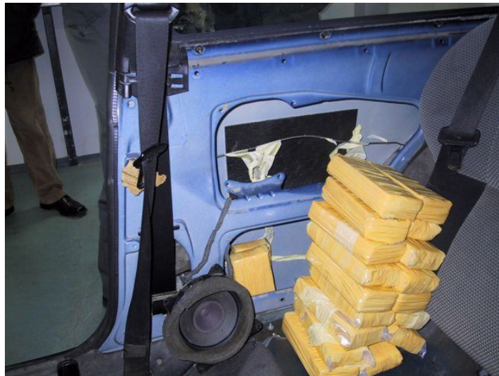
Slika 6: Odkritje mamil na mejnem prehodu