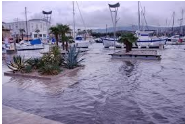
Slika 16: Visoko plimovanje morja

V letu 2012 je bilo zabeleženih 392 naravnih nesreč, od tega močan veter (59), visok sneg (16), neurja (24), žled (3), suša (8), potresi (13), visoko plimovanje morja (13), poplave (83), plazovi (67), toča (8), udari strele (17), pozeba (0), hud mraz (8), huda vročina (1), prekinitev prometa zaradi naravnih pojavov (39), epidemije in okužbe ljudi, živali in rastlin (33).