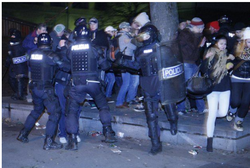
Slika 10: Posredovanje policije med nemirnimi protestniki