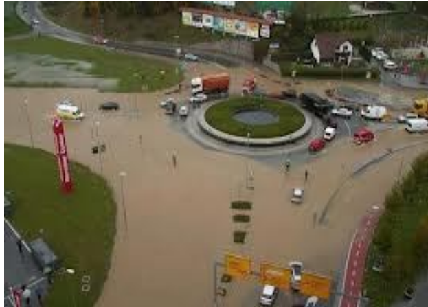
Slika 15: Posledice poplav v letu 2012