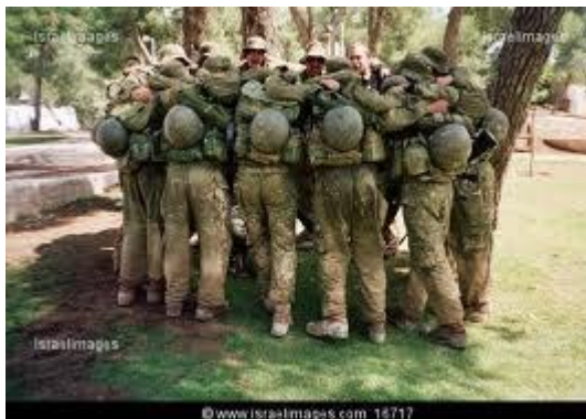
Slika 4: Kolektivni duh

Tovariški slog izboljšuje razpoloženje zaposlenih in je primeren, kadar želimo izboljšati komuniciranje ali povrniti zaupanje v tim ali organizacijo.