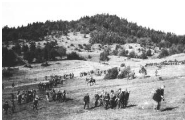
Slika 5: Tovarištvo v partizanih

Kar bi si veljalo zapomniti tudi v današnjih časih, je, da manj kot imamo, manj potrebujemo, da smo srečni in zadovoljni.