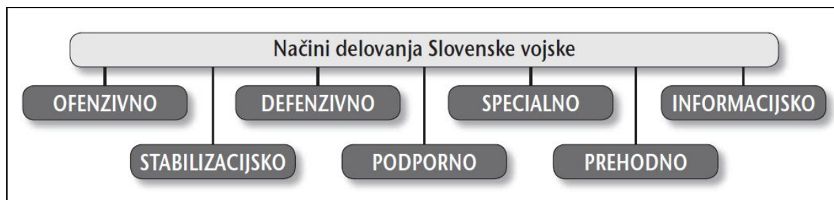
Slika 1: Načini delovanja Slovenske vojske

Načini delovanja Slovenske vojske so ofenzivno, defenzivno, specialno, stabilizacijsko, podporno, informacijsko in prehodno delovanje. Način delovanja sil določa tisto, ki prevladuje po obsegu, intenzivnosti in trajanju. Ofenzivno, defenzivno in specialno delovanje običajno prevladujejo v vojni, stabilizacijsko, podporno in informacijsko pa v miru (Furlan in drugi, 2006, 48).