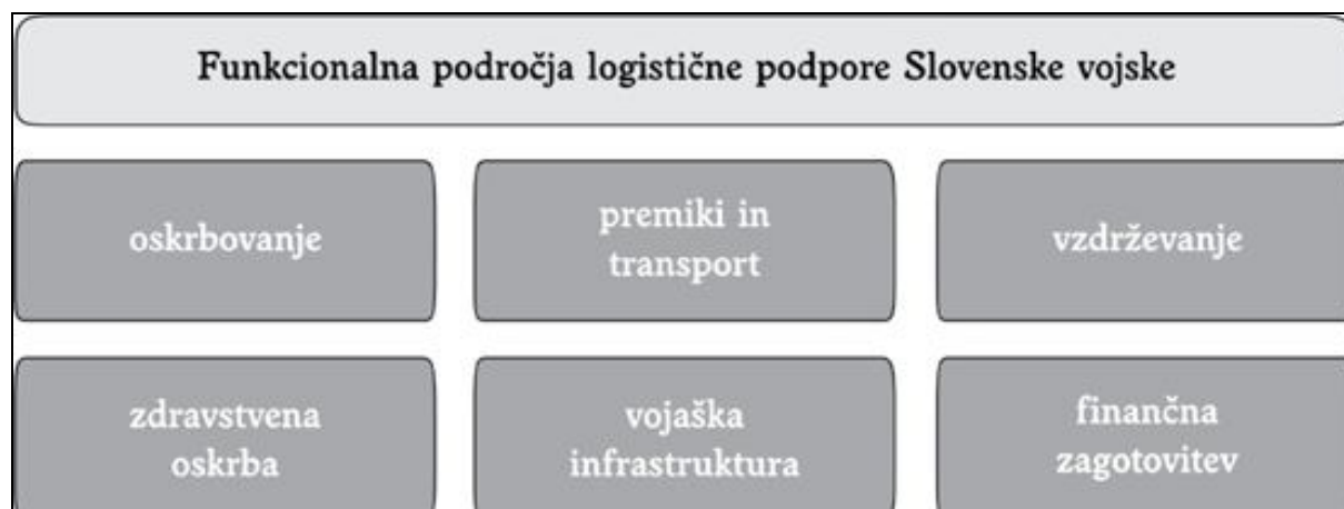
Slika 2: Funkcionalna področja logistične podpore Slovenske vojske

Vir: Doktrina vojaške logistike, 2008, str. 20.