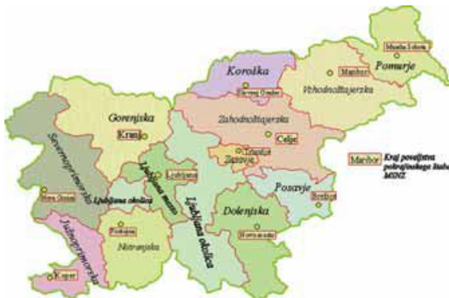
Slika 4: Pokrajinska organiziranost Manevske strukture narodne zaščite

Ozemlje Slovenije je bilo prepredeno s štirinajstimi pokrajinskimi štabi narodne zaščite, glavne usmeritve pa so prihajale iz že predstavljene direktive MSNZ. V tem poglavju bom podrobno predstavil delovanje in dejavnosti posamičnih pokrajinskih ter njim podrejenih občinskih štabov.