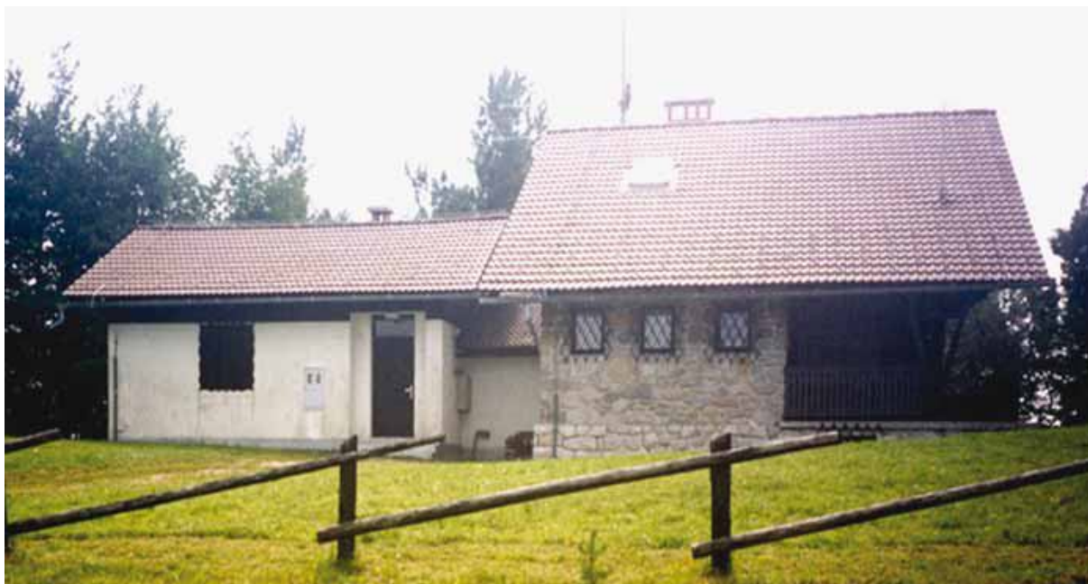
Slika 2: Hiša v kateri je bila sprejeta direktiva MSNZ