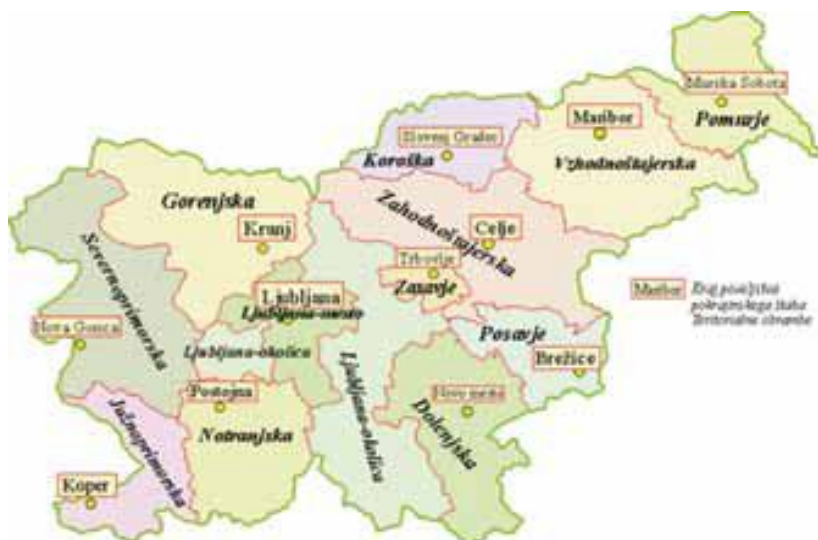
Slika 1: Pokrajinska organiziranost Teritorialne obrambe Republike Slovenije maja 1990

V 80. in 90. letih 20. stoletja se je Teritorialna obramba zelo dobro izurila, a kaj ko so večinoma razpolagali z zastarelo pehotno opremo, večina težke oborožitve v njeni lasti pa je bila v skladiščih JLA. Ravno zaradi teh razlogov so 1990 začeli razvijati lastno opremo vključno z novo uniformo, brzostrelko MGV 176, in sicer vse pod vodstvom sekretarja za ljudsko obrambo občine Kočevje Toneta Krkoviča.