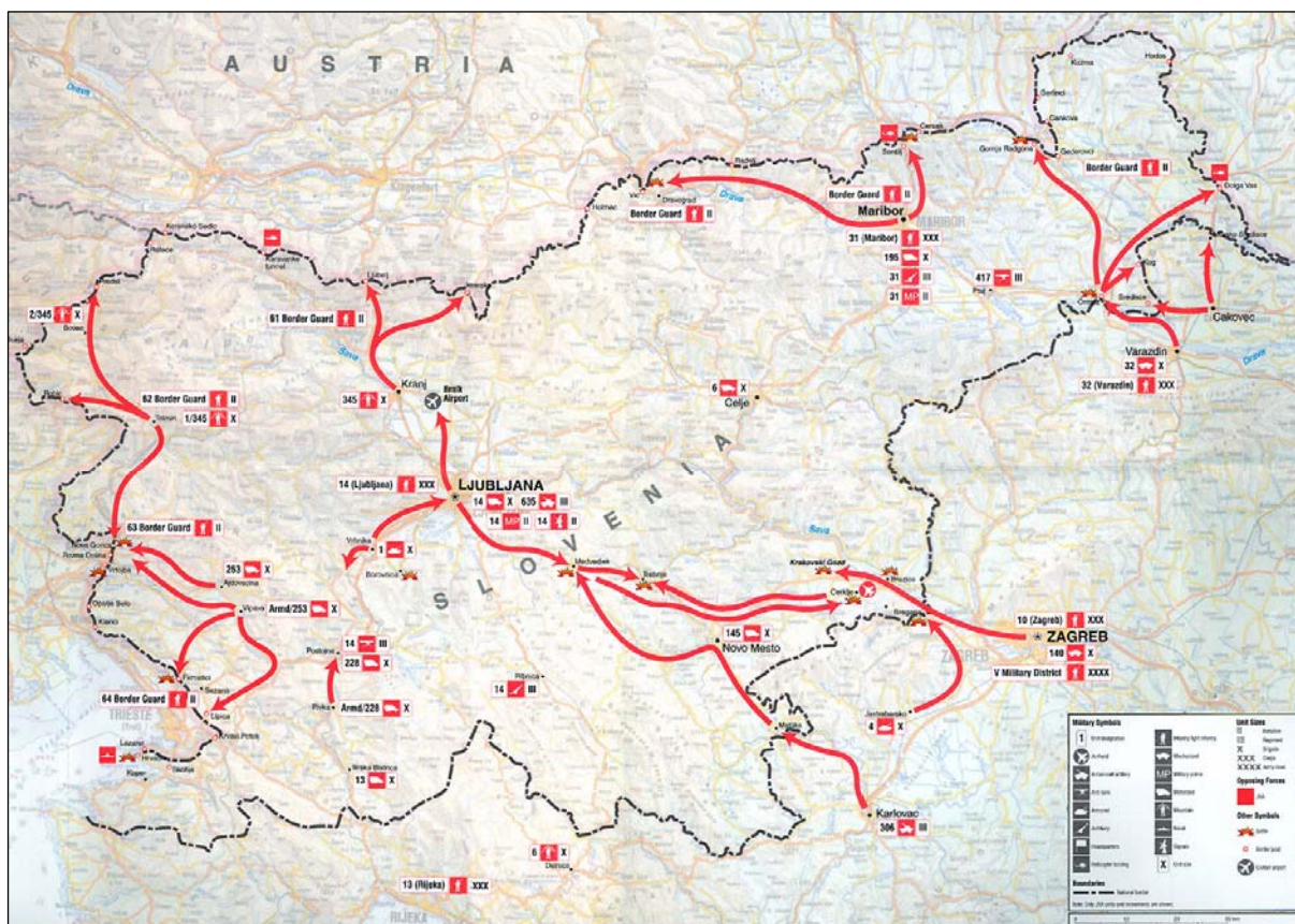
Slika 1: Prikaz operacij JLA med slovensko osamosvojitveno vojno