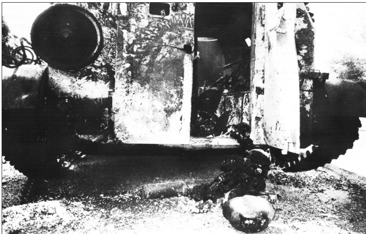
Slika 3: Uničen oklepni transporter JLA

Zajetih je bilo 4693 pripadnikov JLA in 252 pripadnikov zvezne milice, na strani agresorja pa je bilo v vojni uničenih ali poškodovanih 31 tankov, 22 oklepnih transporterjev, 172 transportnih vozil in 6 helikopterjev (Slovenska osamosvojitvena..., 2007).